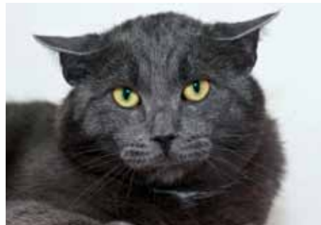
Rio Ferdinand, numera före detta skyggis.

Båda uppsatserna kommer fram till samma slutsats: det finns ingen anle-