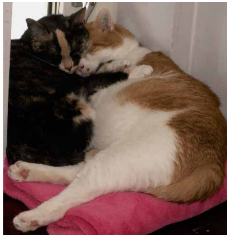
Tummelisa och Moberg fann varandra direkt.