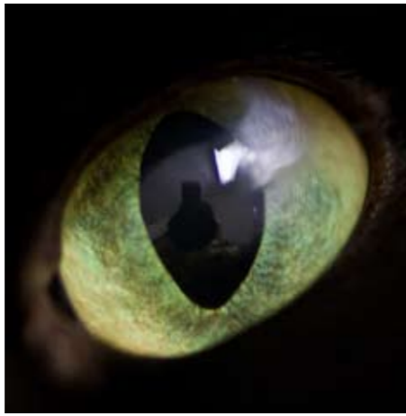
Lovisas öga i dag. Ärret efter operationen kan ses som en grå skugga.